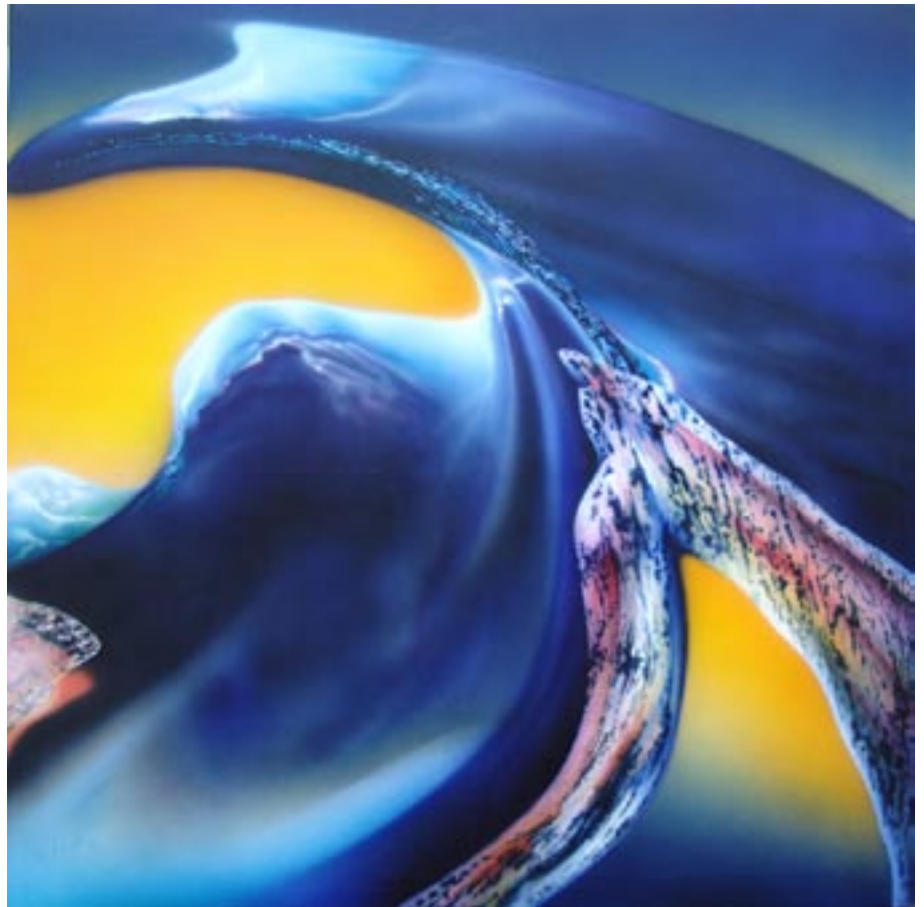
Zeittunnel, von Urs A. Furrer, 1997, auf Maltuch (Format 145 x 145 cm)